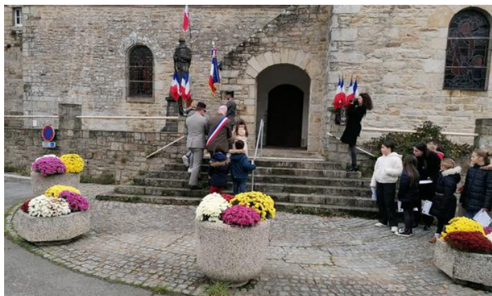
Dépôt de gerbe

En fin de la commémoration un verre de l'amitié était offert par la Municipalité.