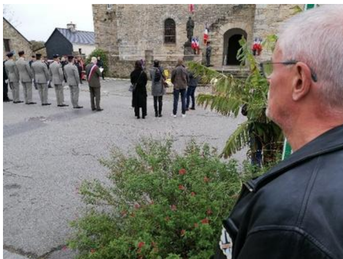
La cérémonie