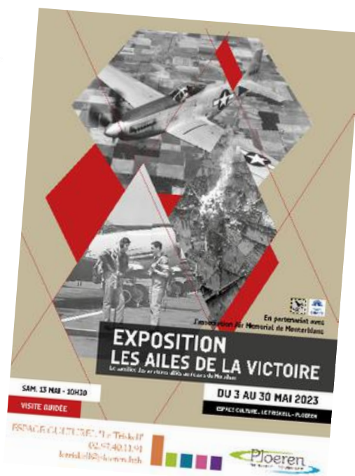
Affiche de l'exposition