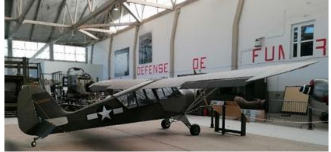
L'Aeronca Defender type L3 de 1941

Figure aussi dans la collection du musée un authentique avion de liaison, d'observation et de réglage de tirs de l'armée américaine « Aeronca Defender type L3 » de 1941. Ce type d'appareil moins connu car moins médiatisé que les avions de chasse ou les bombardiers de l'USAAF a néanmoins largement participé à la victoire finale.