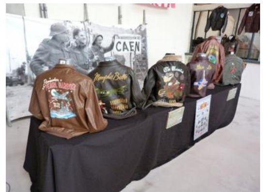
Exposition « Le Cuir des Anges au D-Day Wings Museum / Photo Air Mémorial.

A l'heure du bilan, début septembre, plus de 8 700 visiteurs ont découvert l'exposition "Le cuir des anges" avec de nombreux étrangers. Les éloges ont été nombreuses et nous encourageant pour une prochaine collaboration.