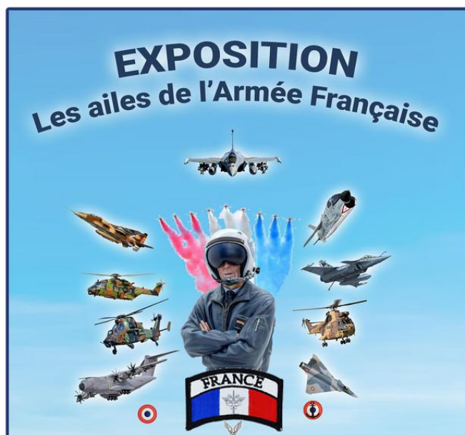
Visuel de l'exposition / Création : Air Memorial

Les trois armées sont représentées, l’Armée de l’Air, l’Aéronautique Navale, l’Aviation Légère de l’Armée de Terre et modestement la Gendarmerie et la Sécurité Civile.