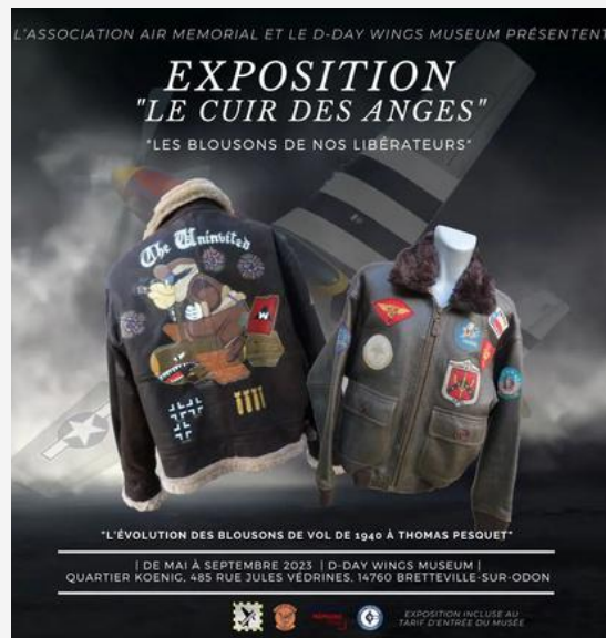
Affiche exposition "Le cuir des anges"