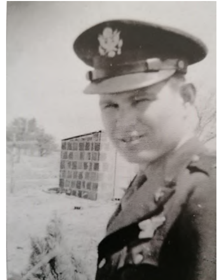
Lt. Willard S. Thomas en 1942

Le but de l'association créée en 1994 est d'effectuer des recherches sur la guerre aérienne en Bretagne pendant la seconde guerre mondiale et notamment, entres autres objectifs, d'organiser des expositions et des cérémonies commémoratives en l'honneur des aviateurs alliés qui ont combattu dans le ciel breton.