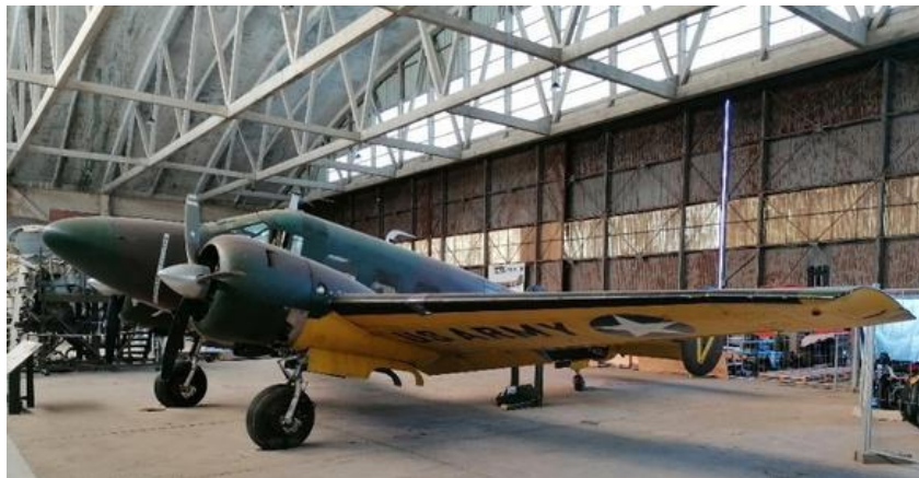
Beech 18

Tout au fond du hangar un « Beechcraft 18 » (ou C-45 en version militaire) qui a formé nombre de pilotes, copilotes, navigateurs et bombardiers aux Etats-Unis est en exposition. Ce véritable exemplaire a été construit après-guerre en 1958.