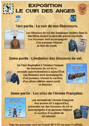
Flyer exposition "Le cuir des anges" / Création : Air Memorial

L'exposition "Le cuir des anges" sera présentée, avec ses trois parties, lors des Journées Européennes du Patrimoine les 21 et 22 septembre 2024 à Pluvigner, salle de la Madeleine.