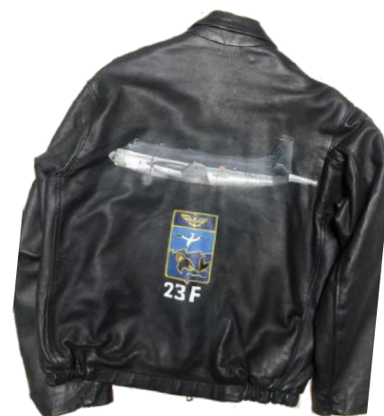
Trois blousons de la collection / Création : Fanny Canioni - Regnault

Si vous souhaitez voir d’autres de ses créations vous pouvez aller sur la page Facebook “Créations de Fanny La Fée Main”.