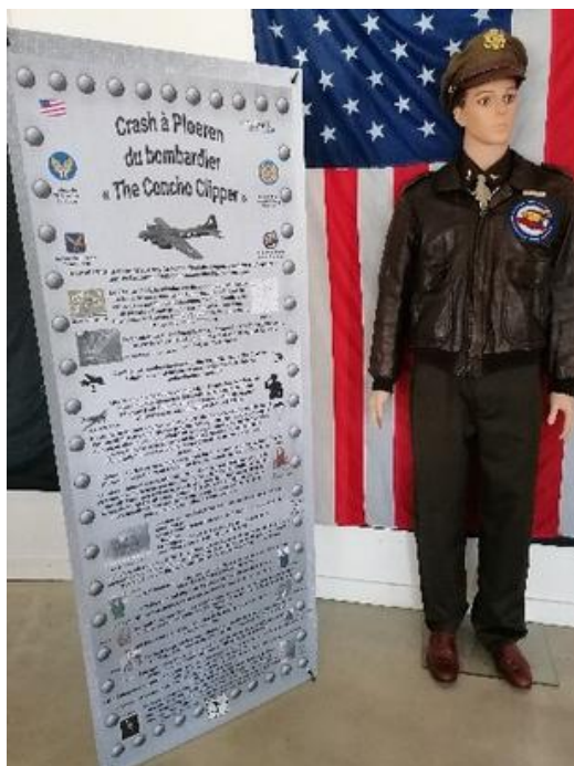
Panneau du crash de Ploeren / Photo : Air Memorial

La municipalité de Ploeren, répondant à notre sollicitation, accueillait l'exposition « Les ailes de la victoire » le sacrifice des aviateurs alliés au-dessus du Morbihan durant la seconde guerre mondiale.